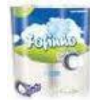
Papel higiênico fld cód 1004