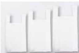
Sacolas recicladas brancas cód 1030