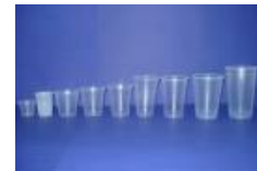
Copos e tamanhos PP cod 1015