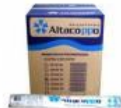
Norma da ABNT cód 1021