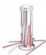
Sup p/canudos cod 1193