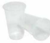
Copo Translúcido cod 1011