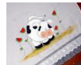
Pano de prato cod 1041