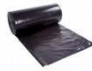
Lona preta cod 1370