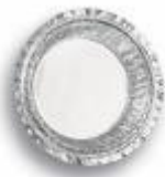
Marmitex Bandeja cod 1043