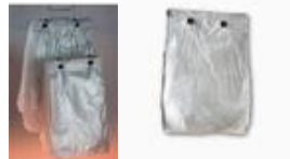
Sacos blocados Cod 1570