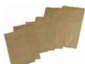
Papel PP Pardo Cód. 1151