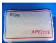
Toalha americana cód 1121