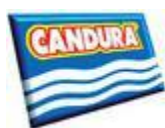
Logomarca Cod 1380