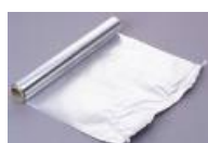
Papel alumínio cód 1210