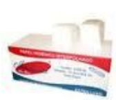
Papel indaial interfolhado Cód 1071