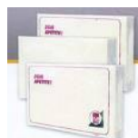
Toalha americana cód 1121