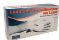
Luvas de Procedimentos Cód 1180