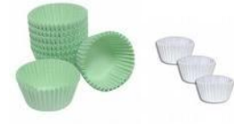
Forminhas vários tamanhos cod 1420