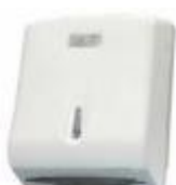
sup de interfolha cód 1191