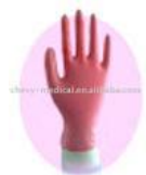
Luvas sanrro cod 1181