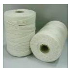
Barbante Cod 1350