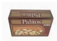
Palitos de dentes cód 1160