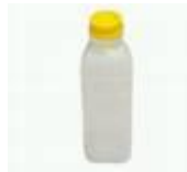
Garrafa viagem Cod 1400