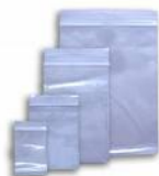
Sacos PP Tamanhos Cód 1100