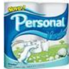
Papel Higiênico fs Cód. 1001

Via Igarapés, 163 - Jd. Laura - Campo Limpo Paulista