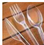
Talheres descartáveis cod 1051