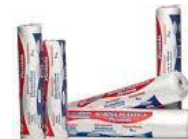
Bobinas picotadas cod 1590