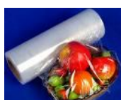
Filme para alimentos cód 1220