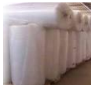
Bobina plástico bolha Cod 1280