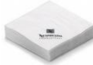
Guardanapos cod 1044