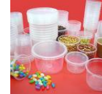
potes cod 1370