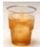
Copo acrílico cod 1013