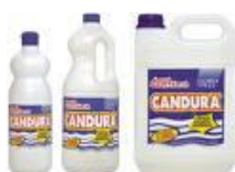
Água sanitária cod 1380