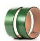
Fita para arquear cod 1320