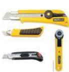
Estiletos e canetões cod 1360