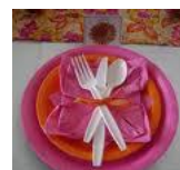
Descartáveis festa e Pratos cod 1052