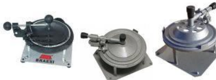
Selador de marmite Cod 1430