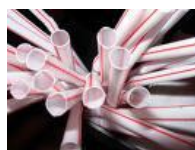
Canudo Ola milk Cod 1060