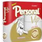
Papel higiênico fld cód 1002