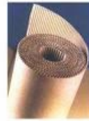
Bobina papelão cod 1290