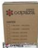
norma da ABNT Cod 1022