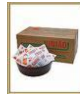
Açúcar saché cod 1440