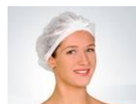
Touca TNT cód 1130