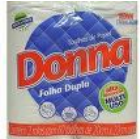
Papel toalha Cod 1700