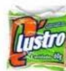
Lã de aço cod 1640