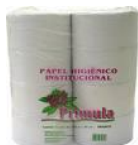
Papel rolão cod 1081