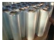
Bobina filme stretch cod 1310