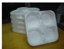
Suporte de viagem para marmite Cod 1412