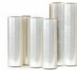
Filme PVC cod 1600