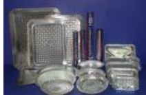
Bandejas aluminizadas Cod 1460