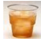
Copo acrílico cod1014