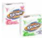
Papel toalha para cozinha Cód 1120