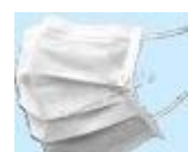
Mascaras brancas descartáveis cód 1171