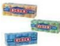
Sabão em pedra Cod 1660