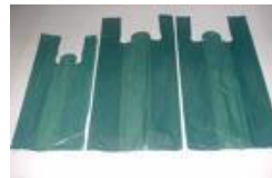
Sacolas recicladas Cód 1032