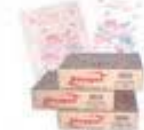
Papel strong cod 1080