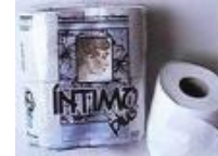
Papel higiênico cód 1005