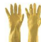
Luvas de látex cod 1185