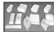
Papel PP Branco cod 1150