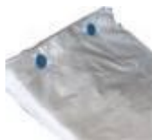
Folha blocada Cod 1390