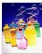
Variedades de produtos cod 1381