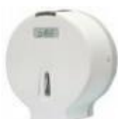
Sup papel rolão Cód 1190