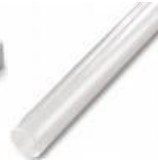
Papel celofane Cod 1200