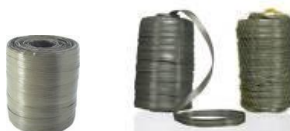
Fitalho Cod 1300