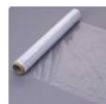
Filme para alimentos cód 1220