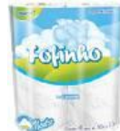
Papel Higiênico fs cód 1003